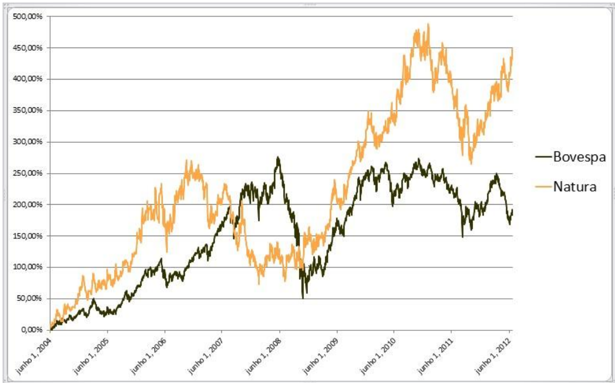
Gráfico 1. Comparação entre dados do mercado e da Natura

Além disso, foram comparadas as margens EBITDA, as margens de Lucro Antes dos Juros, Impostos, Depreciação e Amortização, da empresa durante o mesmo período analisado, visto que indicam a relação entre os custos da organização e o desempenho da empresa. Os dados apontam o bom desempenho da Natura no EBITDA médio e também sobre a margem corrente. O Gráfico 2 ilustra o EBITDA médio da empresa ao longo do período analisado. Por sua vez, o Gráfico 3 apresenta o EBITDA de cada ano, em recorte aleatoriamente selecionado, o que corrobora as indicações da análise do Desempenho das Ações de Mercado.